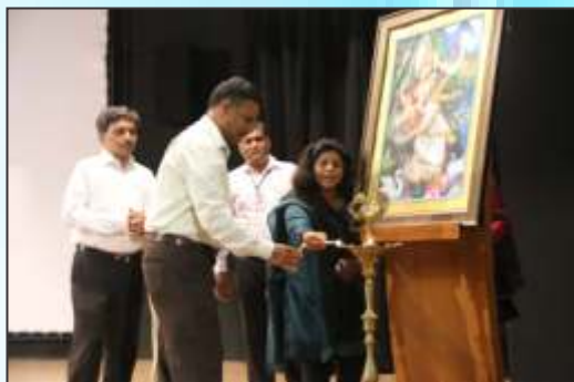
The Guests & Dignitaries lighting the lamp in front of Goddess Sarasvati