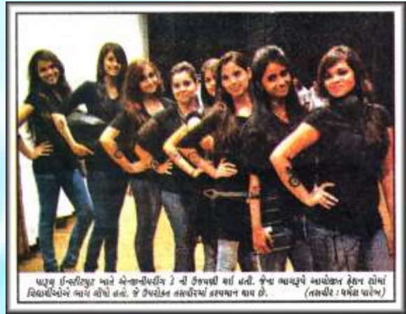
Gujarat Mitra 15-09-2013