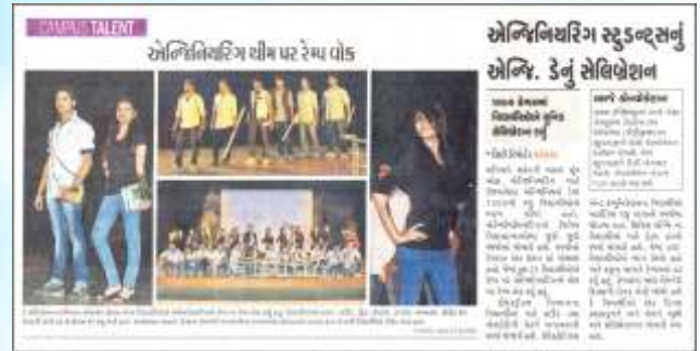
City Bhaskar 15-09-2013