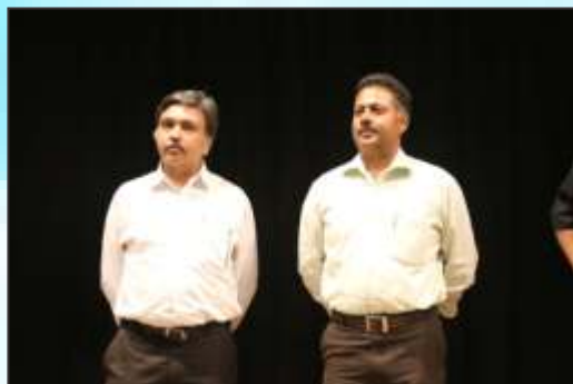
Chief Guest & Guest of Honor on stage