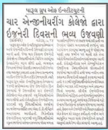
Gujarat Mitra 15-09-2013