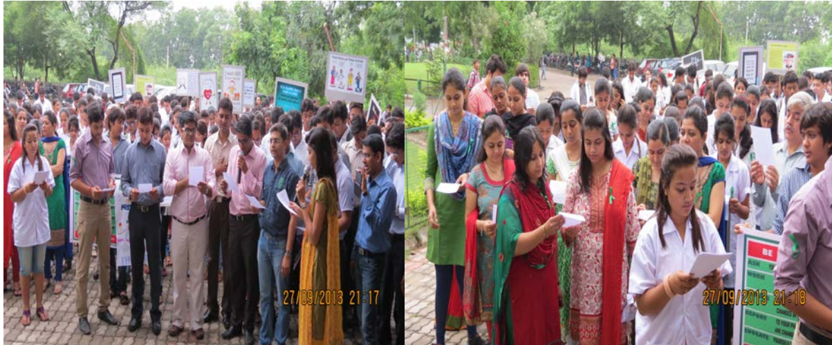
Students, wearing green ribbons and aprons with banners in the hand, started a rally which went through all the institutes within the campus.