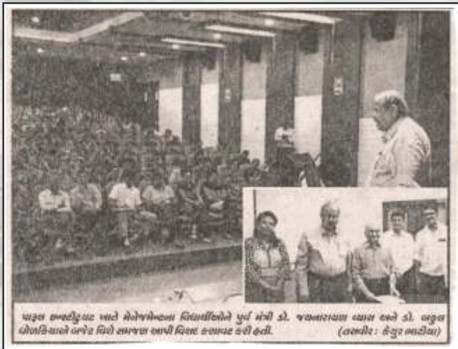
પાણલ સભ્યોએ આજે મેનેજમેન્ટના વિદ્યાર્થીઓને પૂર્વ મંત્રી ડૉ. જયનારાયણ વ્યાસ અને ડૉ. બકુલ ધોળકીયાએ બજેટ વિશે સમગ્ર ભાષી વિસ્તર કરાવ્યું હતું.