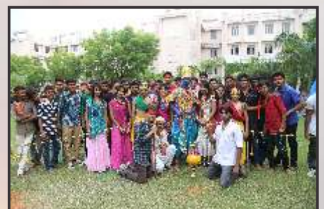
Dahi Handi Preparation