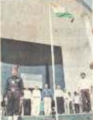
સુભનદીપ વિદ્યાપીઠમાં ગોફેસલ અને સ્ટુડન્ટ્સની કાવ્યદીપા ધ્વજવંદન કરવામાં આવ્યું હતું.