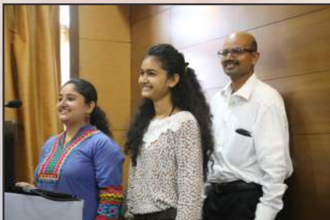
SKIT by students of Parul Group of Institutes