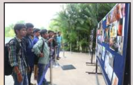
Exhibition outside the Central Administration Block