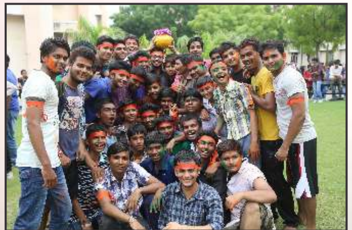
Students set for Dahi Handi Ceremony