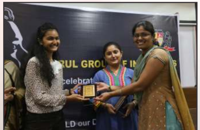
Felicitating of Guests