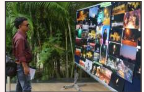
Winners of the competition