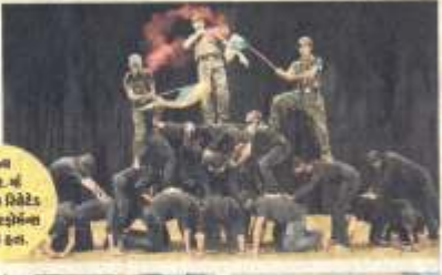
ધરુભ ઇન્ડિપેન્ડન્સ ડે દરમિયાન સિદ્ધીની વિવિધ ઇન્સ્ટિટ્યૂટ્સમાં સેલિબ્રેશન કરવામાં આવ્યું હતું.

સિદ્ધી રિપોર્ટર - મદીહસ આવૃત્તના ૬૬માં ઇન્ડિપેન્ડન્સ ડેનું દિવસભર સિદ્ધીની વિવિધ સંસ્થાઓમાં સેલિબ્રેશન કરવામાં આવ્યું હતું. આ સેલિબ્રેશનમાં ધ્વજવંદનના પ્રોગ્રામમાં દેશભક્તિને સમર્થતા સ્વરૂપે પ્રોગ્રામ્સ પણ યોજવામાં આવ્યાં હતાં. શહેરની પોદાર સુલ્યા ઇન્ડિપેન્ડન્સ ડેની સાથે સ્ટુડન્ટ્સે જાન પેરેન્ટ્સ સાથે વિશેષ સેલિબ્રેશન કર્યું હતું.