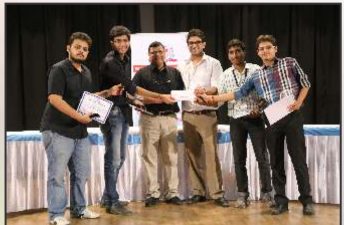
Felicitation of Team from