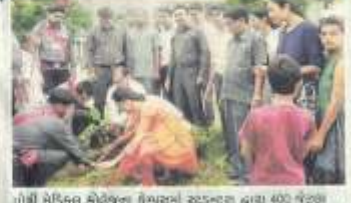
ગોશી મેડિકલ કોલેજના સેન્ટરમાં સ્ટુડન્ટ્સે હાલ ૪૦૦ વેડલા પાલ્લસ રોપાયાં હતાં. તેમાં ડીન ઇન્ડિયા પરમાટ ઉપસ્થિત રહ્યાં.