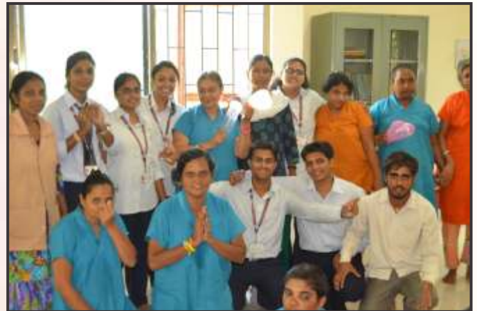
Students spent time with orphans at Don bosco Snehalaya tying Friendship Bands and playing games.