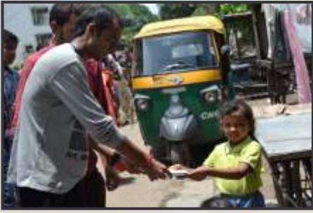
Friendship Days Celebration at some slums in the city.