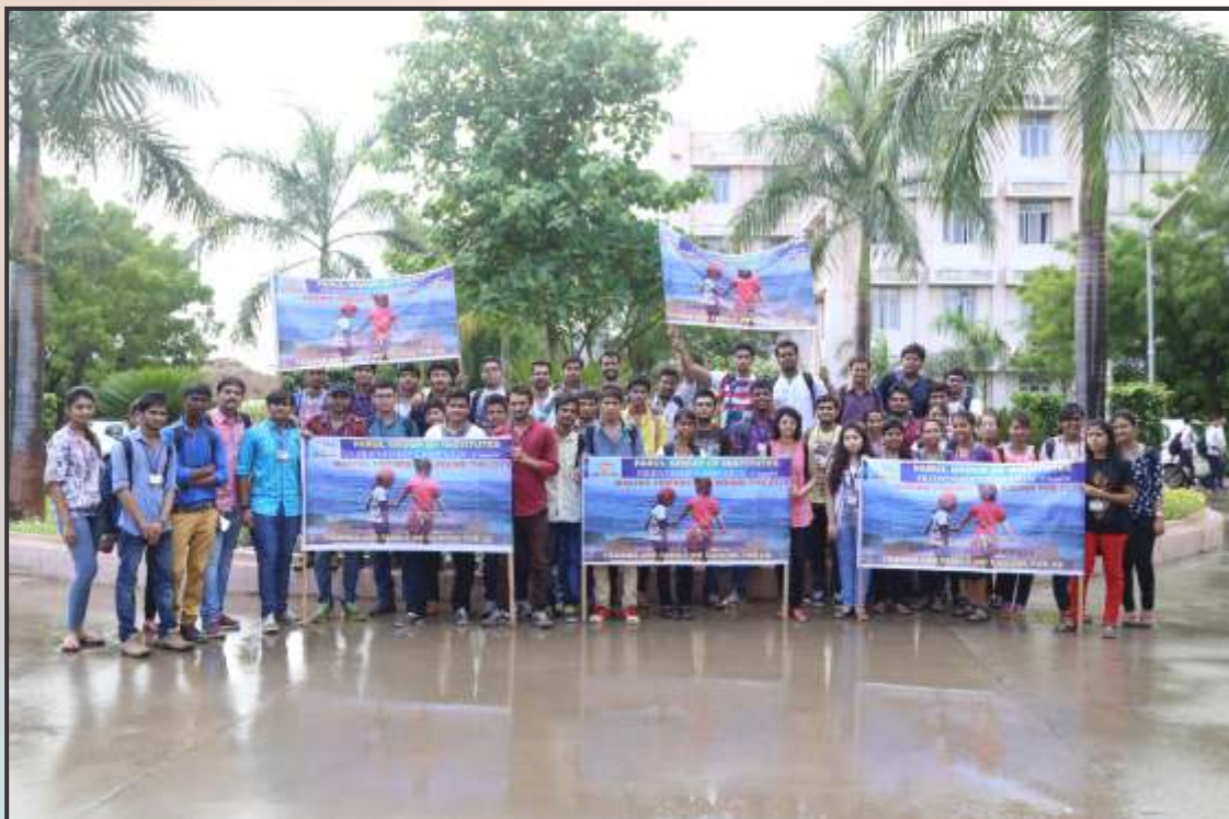
Friendship Days Celebration got a kick start from campus even in the heavy rains.

Students served to the mentally challenged with love & affection assuring them that they still have friends. For children at financially unaided schools, students gifted books and pens All students who participated in this activity were deeply touched by the experience of meeting people in need of friends. Hence they vowed to visit these new friends every month and make them feel even more special. Living up to "Har Ek Friend Zaroori hota he", the students proved that each of us can be friends irrespective of our caste, financial condition and physical abilities.