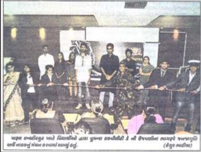
પારૂલ ઇન્સ્ટીટ્યુટ ખાતે વિદ્યાર્થીઓ દ્વારા વુમન્સ ઇક્વિલીટી ડે ની ઉજવણીના ભાગરૂપે જનજાગૃતિ હાર્વે યાદગરનું મંચન કરવામાં આવ્યું હતું. (કેપ્શન ભાગીયા)