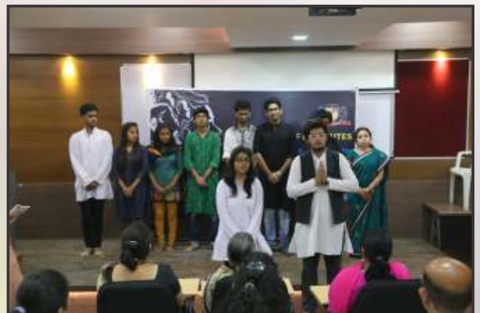
Vaidhya Family addressing the gathered students & guests