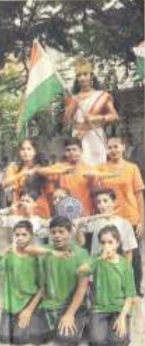
એલે વિદ્યાલય, શહેરોબનમાં સ્ટુડન્ટ્સે સ્વાતંત્ર્ય પર્વ સિલેટ વંસનુપા કરીને દેશભક્તિના કાલક કરી હતી.