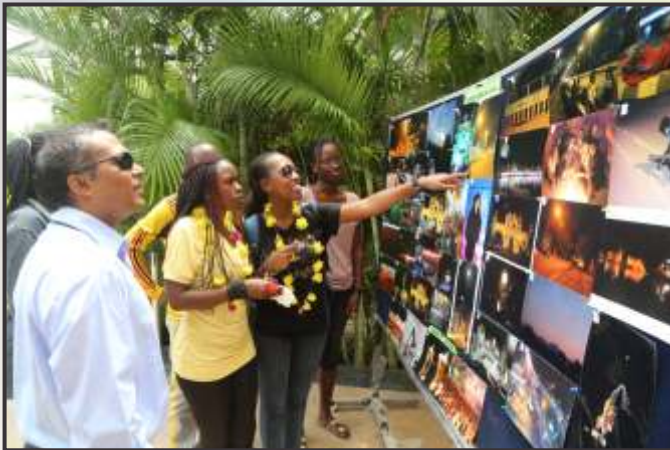
International Students visit the Exhibition